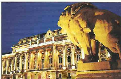
Budavár – udvar