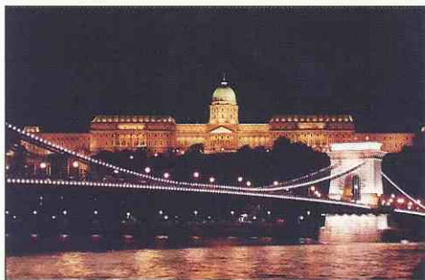
Budavár és Lánchíd